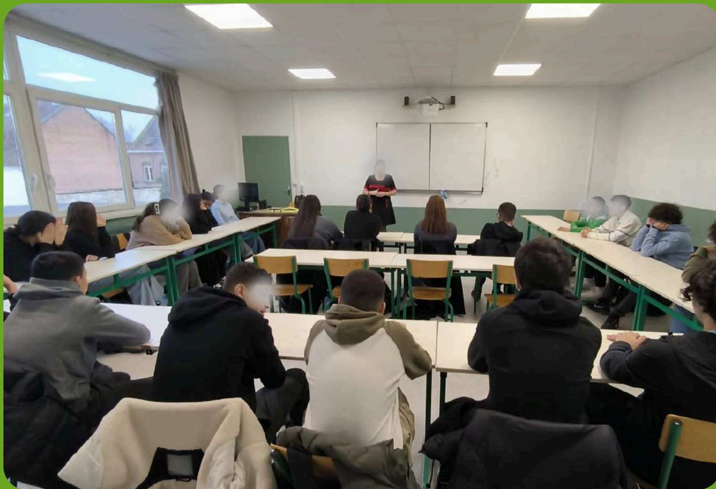
Dans le cadre du parcours professionnel de nos élèves, des professionnels sont venus leur présenter leur métier. Ici, une infirmière parle de sa mission à des élèves de 3ème.